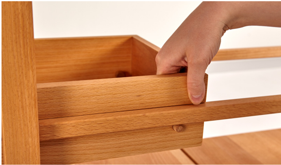
8. Ladenstopper nach außen drücken. So kann die Lade weder vorne noch hinten aus dem Regal fallen.