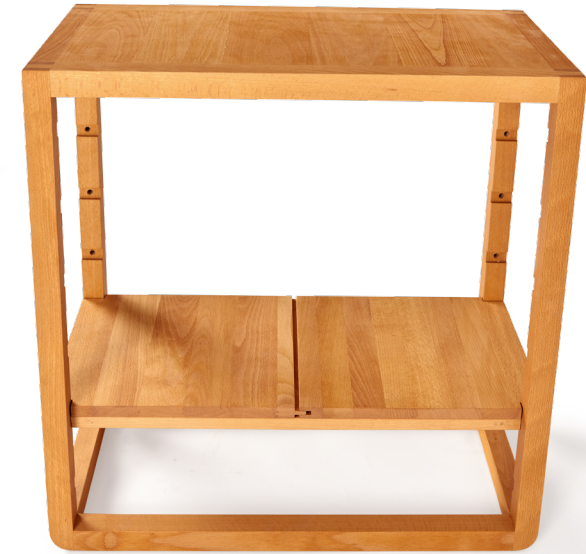
5. Regal mit eingelegtem Fachbrett.