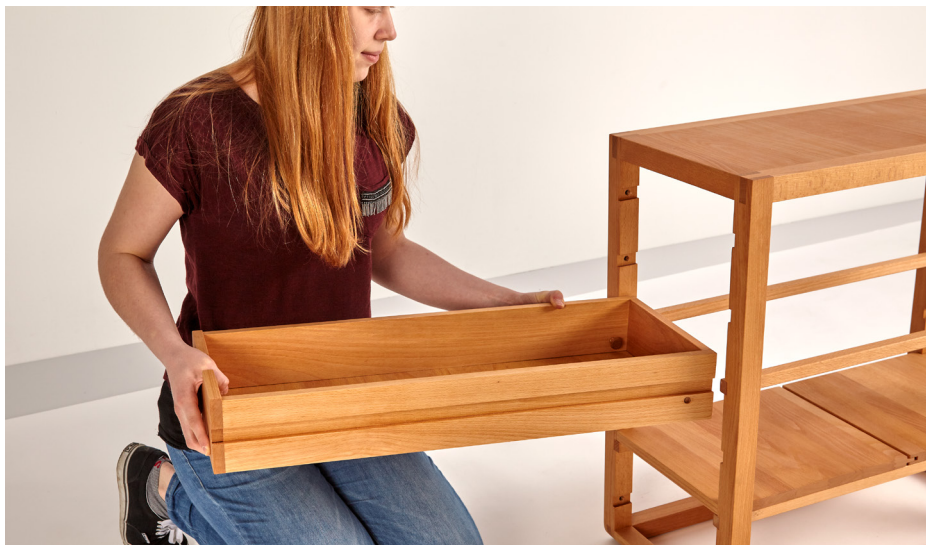
7. Laden auf die Laufleisten schieben.