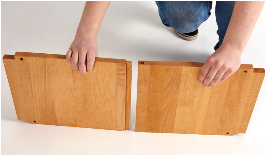
3. Die beiden Teile des Fachbrettes in Nut und Feder fest zusammenstecken.