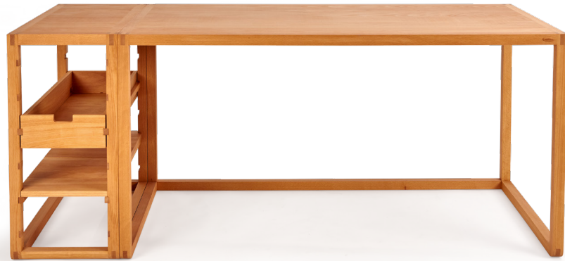
11. Mit dem Schreibtisch Quint verbundenes Regal, hier mit einem Fachbrett und einer Lade.