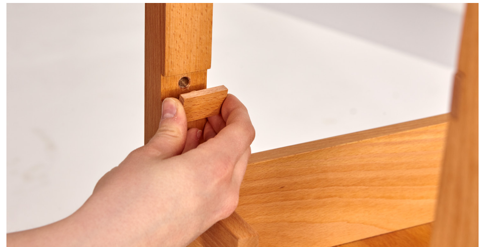
9. Für eine schönere Optik Abdeckplättchen auf frei bleibende Ausnehmungen setzen.