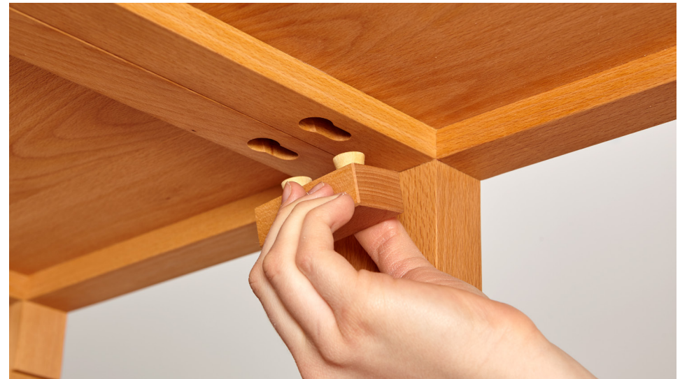
10. Zur festen Kopplung des Regals an den Schreibtisch Quint die beiden Verbindungsteile wie abgebildet montieren: Gratdübel an der weiten Stelle der Ausfräsung einsetzen und dann zur engen Stelle hin festziehen.