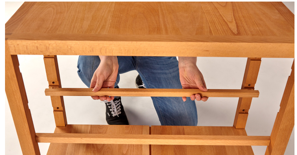
6. Laufleisten für Lade in der gewünschten Höhe einsetzen.