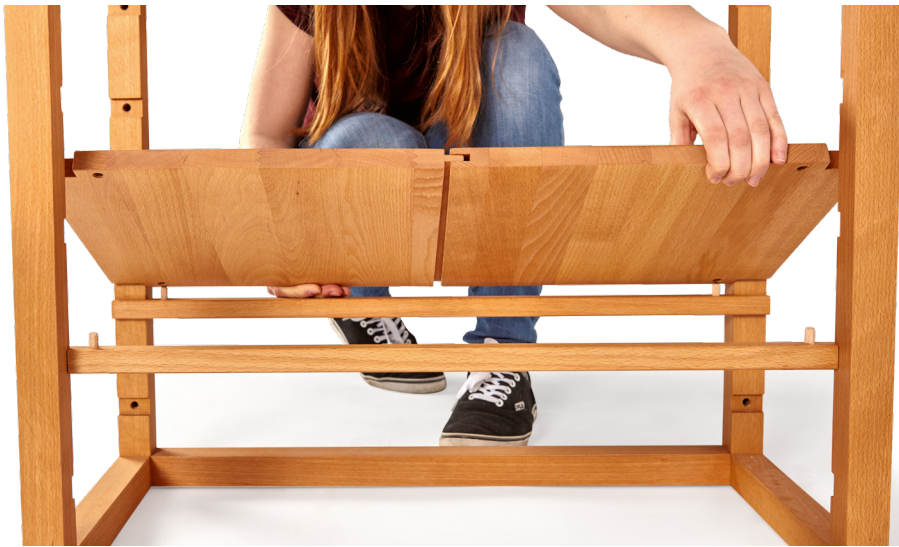
4. Fachbrett auf die Auflageleisten legen (Dübel in die Bohrungen an der Fachbrettunterseite).